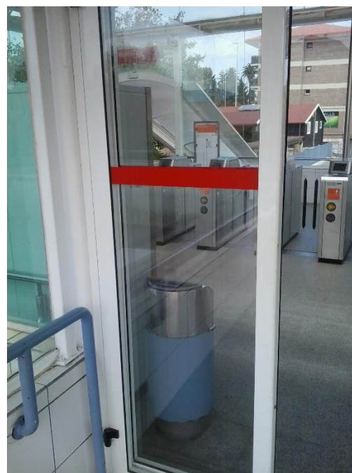
Metro Indautxu-Urquijo, cenicero presente pasados bastantes metros desde la entrada