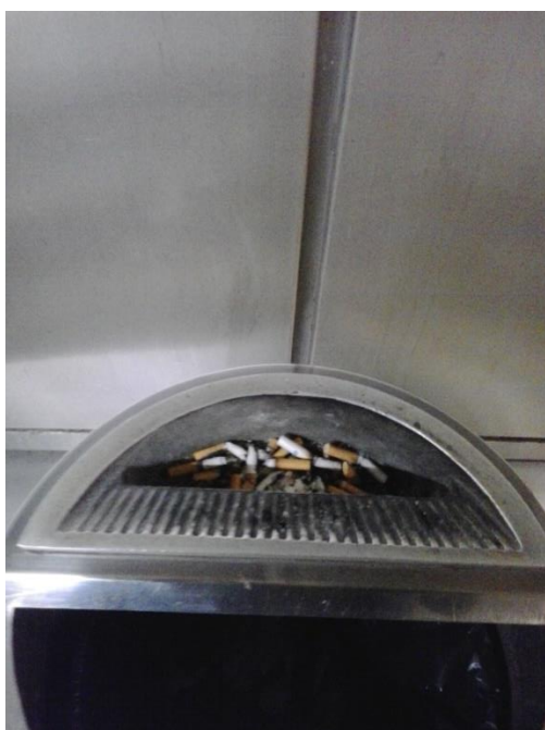
Metro Indautxu-Urquijo, estado que presenta un cenicero, bien entrado en la estación cubierta